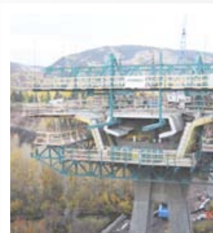
Puente Maroon Creek Colorado, USA