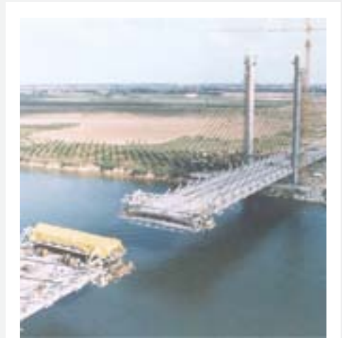
Puente Papaloapan Veracruz