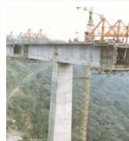
Puente Metlac Veracruz