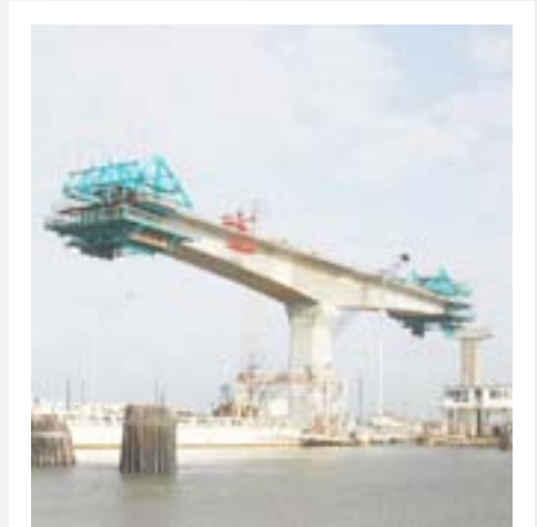
Puente Quintana Texas, USA