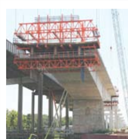
Puente Trinity Texas, USA