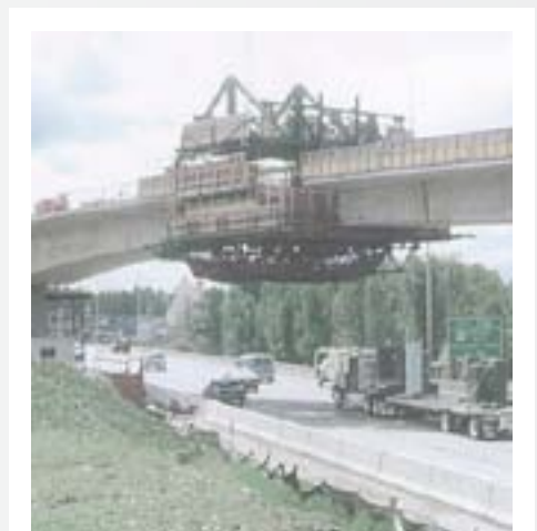
Max Extension / I-205, Oregon, USA