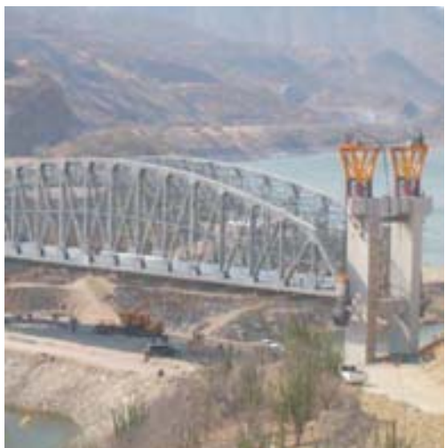
Puente Infiernillo 1, Autop. Morelia-Lázaro Cárdenas