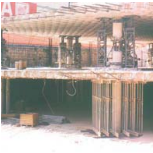
Plaza Colegio Civil, Monterrey