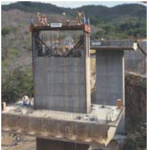
Puente El Pozuelo, Autopista México-Acapulco