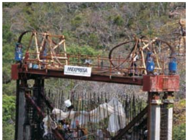
Puente El Pozuelo, Carr. México-Acapulco