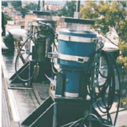
Línea B, Metropolitano Cd. de México