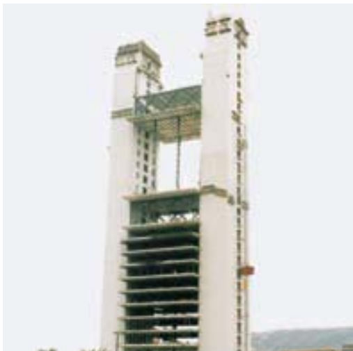
Torre Dataflux, Monterrey