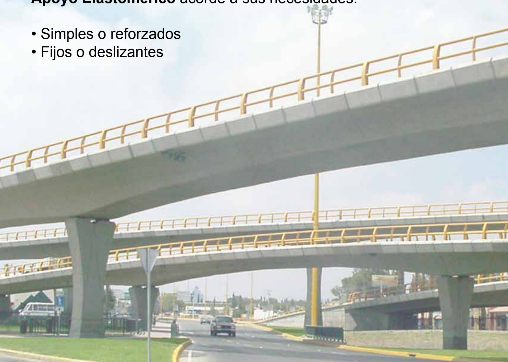
Apoyo Elastomérico fijo