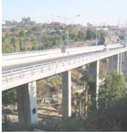
Puente Vehicular Tarango Eje 5 Poniente, D.F.