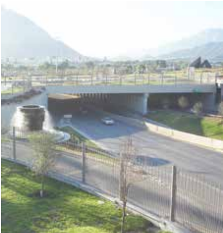
Puente Gran Canal Monterrey, N.L.