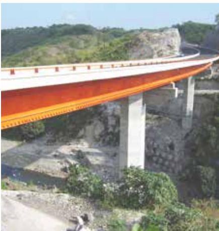
Puente Plan del Río Veracruz