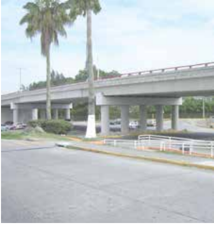
P.S.V. Chedraui Córdoba, Veracruz