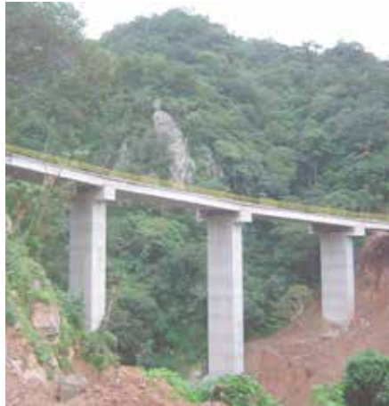
Puente Santa Isabel Autopista Arriaga-Ocozocuautila, Chiapas